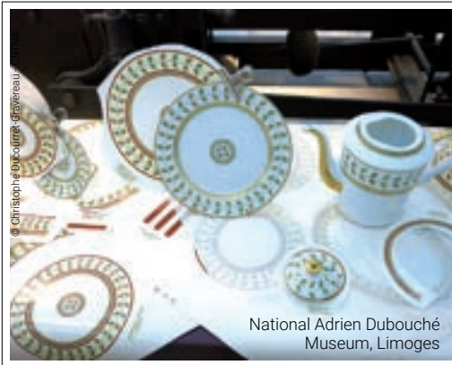
National Adrien Dubouché Museum, Limoges